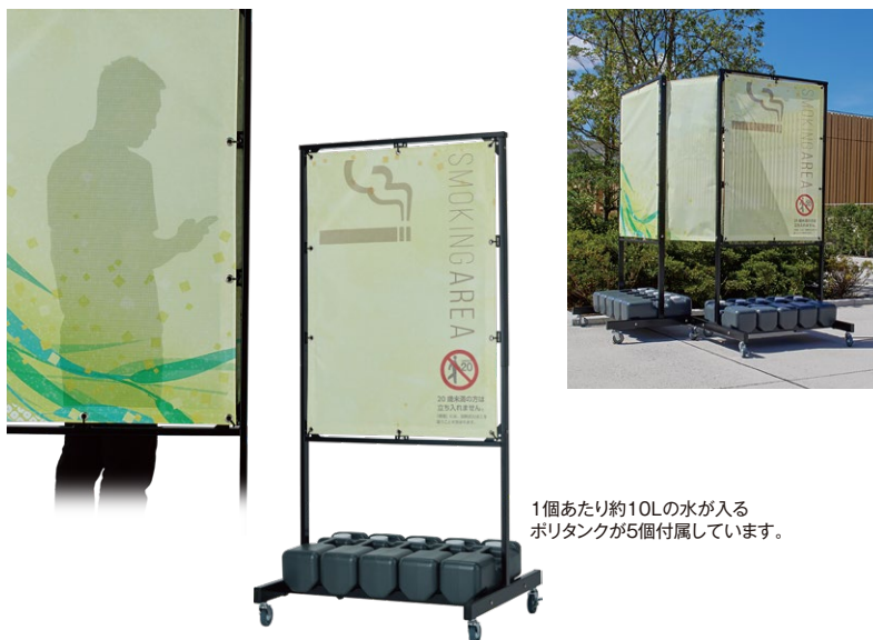
1個あたり約10Lの水が入る ポリタンクが5個付属しています。

条例違反を防ぎ利用者の満足度を高めることで、施設の価値を向上させるチャンス! ぜひこの機会にテラモトへご相談ください。